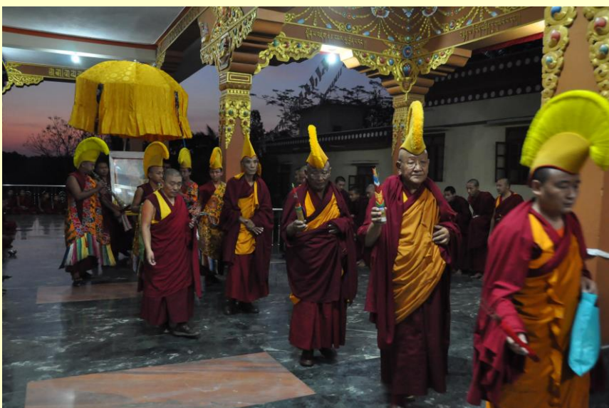
Foto links: tijdens de openingsceremonie wordt het portret van zijne heiligheid de Dalai Lama naar diens troon begeleid.