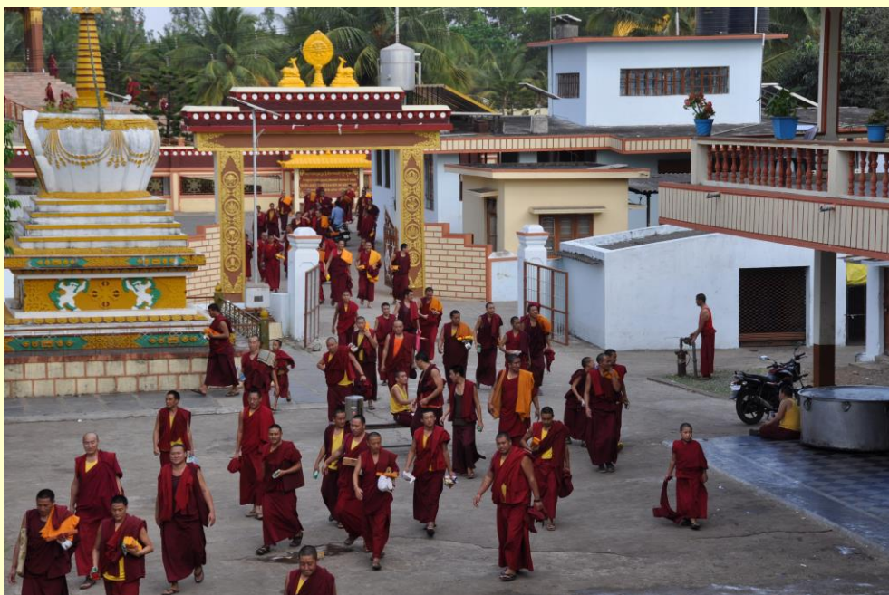
Monniken gaan naar hun verblijven na afloop van de lessen.

Maar allereerst willen we u allen hartelijk bedanken voor de steun die we voor de diverse projecten mochten ontvangen. Zo helpt u de Tibetaanse vluchtelingen in India en dragen we gezamenlijk bij aan het behoud van de Tibetaanse cultuur. In het financiële jaarverslag kunt u lezen aan welke projecten u gezamenlijk hebt bijgedragen.